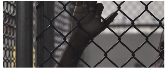
Imagen de archivo de un preso en una cárcel.